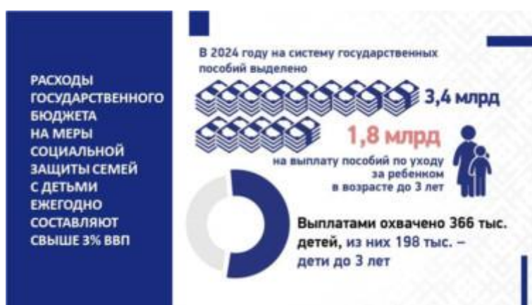
Слайд 12. Выделение государственных пособий семьям

В нее входят, как мы видим, государственные пособия при рождении и воспитании, семейный капитал, социальная помощь и соцслужги, гарантии в различных сферах и др.